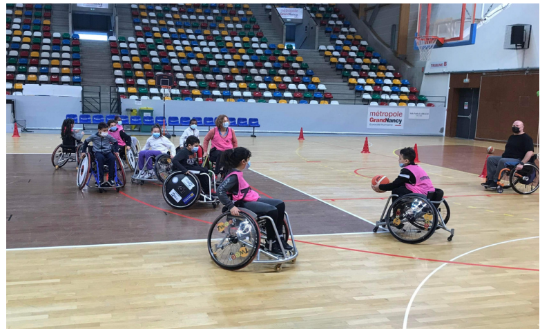
Initiation au handibasket à Vandoeuvre

Le CDOS 54 a profité de cette semaine de promotion du sport et de l'olympisme pour réaliser un maximum d'interventions au sein de ses Classes Olympiques sur tout le département. Au programme : interventions théoriques sur le sport et le handicap, le sport santé, le sport et le développement durable ; interventions de pratiques handisport en partenariat avec le club Handisport de Vandoeuvre, distribution de T-shirts à tous les élèves des Classes Olympiques et de kakémonos à toutes les classes bénéficiaires du dispositif.