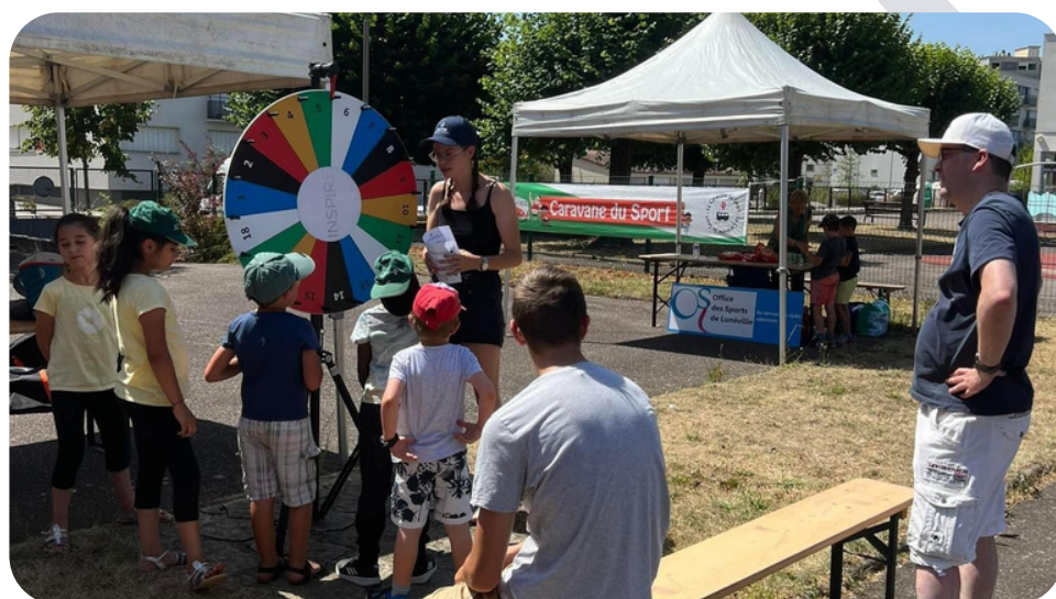
La Caravane du Sport présente à Lunéville

Au total, près de 500 enfants ont pu participer aux animations sur les différentes dates. Un stand INSPIRE a été mis en place sur chacune des dates afin de faire la promotion du Sport Santé et sensibiliser les jeunes au sujet des addictions.